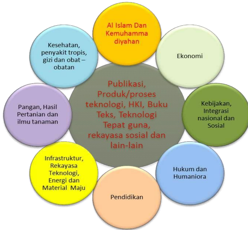
Gambar 4.2. Tema Penelitian UMSU 2018-2023